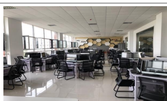
计算机软件开发实训室